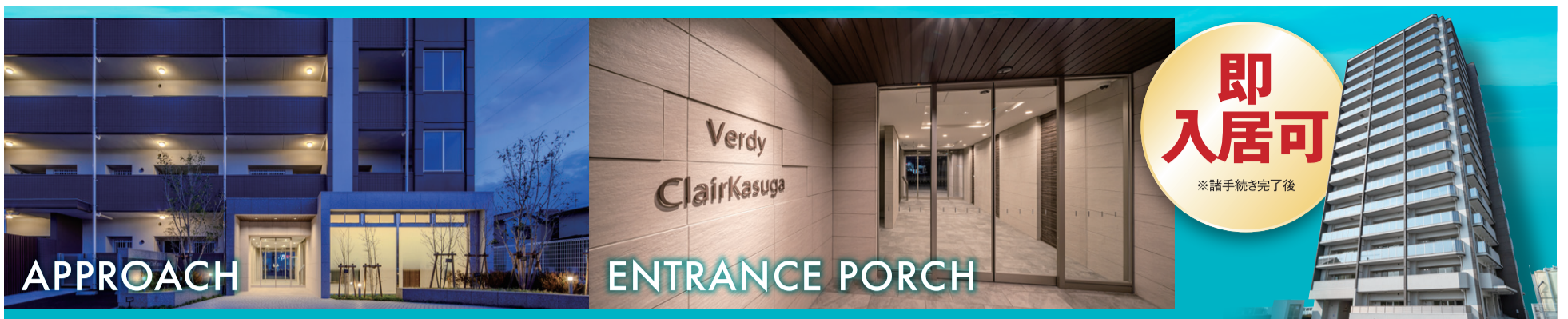
※掲載の各写真は2025年1月に撮影したものです。